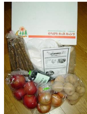
ボックスの中身(一昨年)