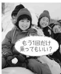
もう1回だけ乗ってもいい?