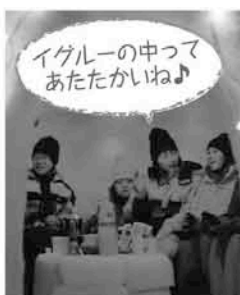
イグルーの中ってあたたかいね♪

プレキャンプの実施にあたり、様々なご支援をいただきました個人・団体みなさまに、心より御礼を申し上げます。