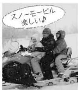
スノーモービル楽しい♪